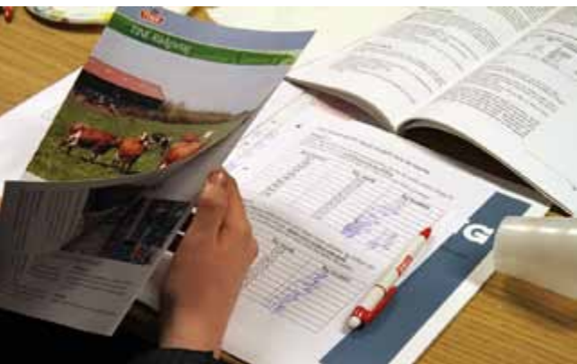
En avløser skal ikke være noen førings spesialist, men grunnleggende kunnskap om føring er en viktig del av kurset.