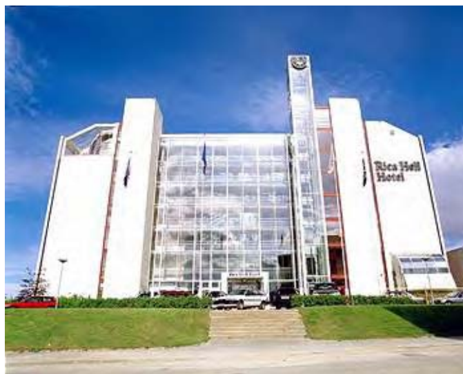
Årsmøtet vart halde på Rica Hell Hotell i Stjørdal.