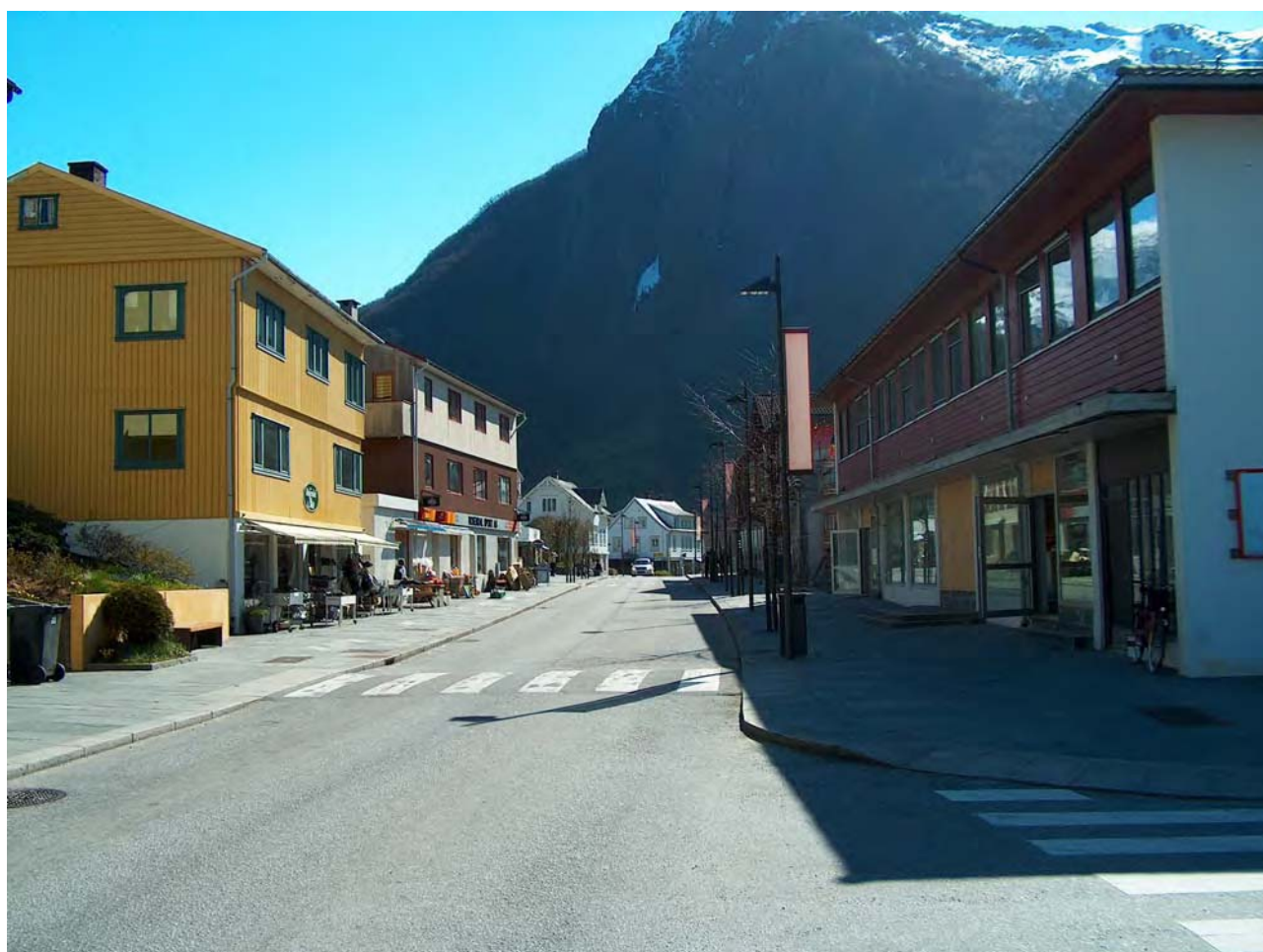
Bilete frå Skålagato. NLT held til i andre etasje i lokala til høgre i bilete