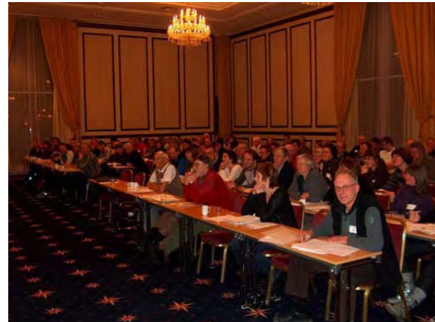
Frå haustsamlinga i Stjørdal

Evalueringa viser at laga stort sett er tilfreds med den form og innhald samlingane har, sjølv om det er vanskeleg å tilfredsstilla alle sine ønske.